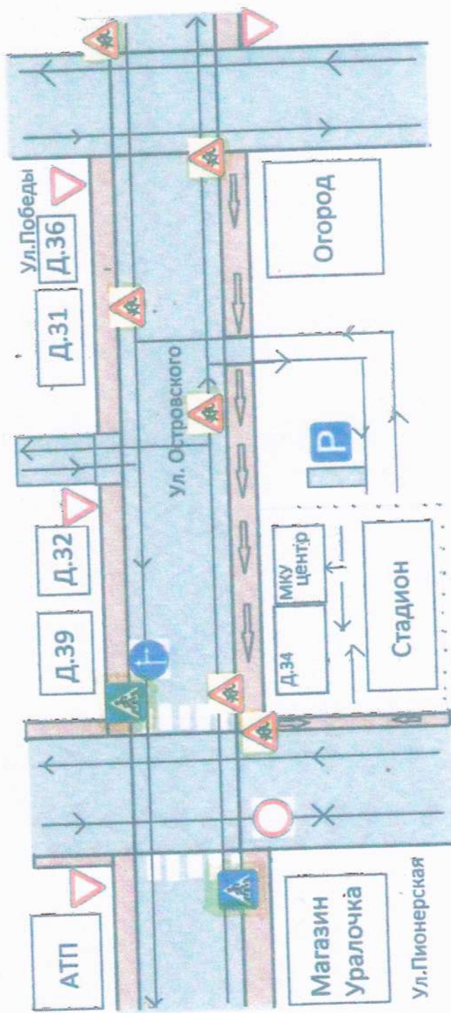
Схема организации дорожного движения в непосредственной близости от учреждения мку центр с размещением соответствующих технических средств, маршруты движения детей и расположение парковочных мест.